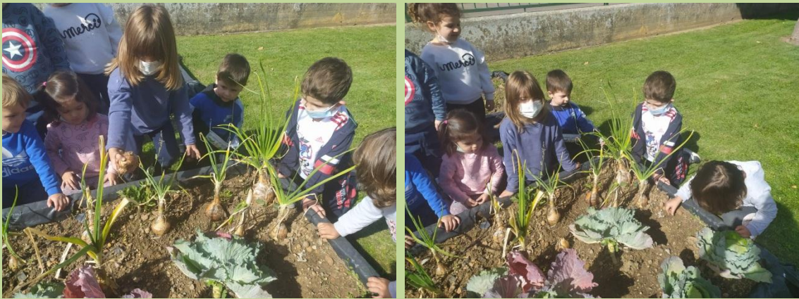
Cebollas y berzas...